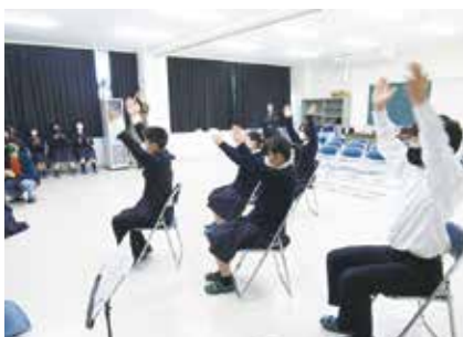
生活デザインコース 音レク広場