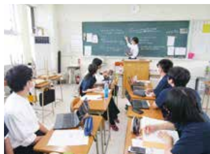
いじめフォーラム