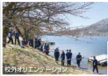
校外オリエンテーション