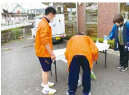
地域ボランティア