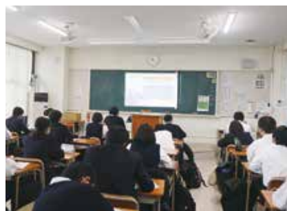
スマホ携帯安全教室