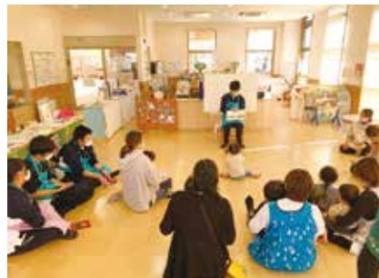
榛名児童館での保育補助 (スマイルクラブの活動)