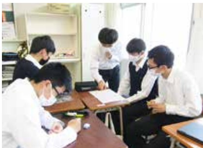
話し合い活動 (学校生活宣言の提案)