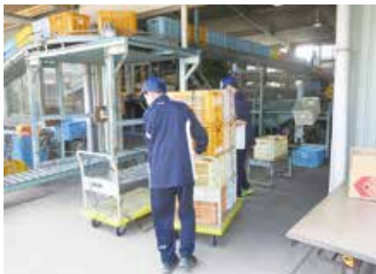
グリーンファーム体験