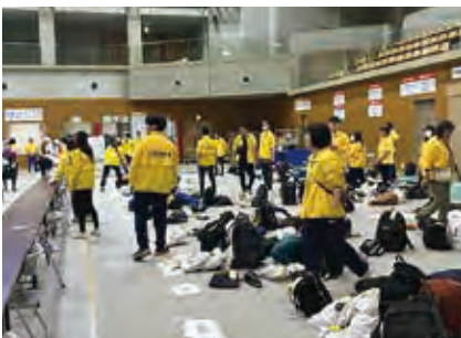
ハルヒルボランティア