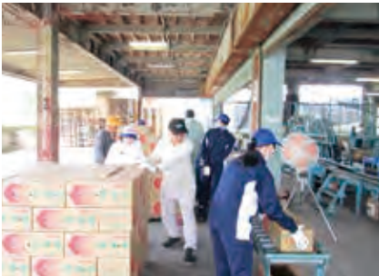
グリーンファーム体験