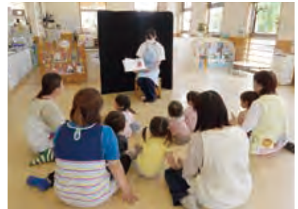
榛名児童館での保育補助 (スマイルクラブの活動)