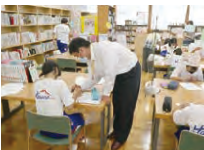
地域ボランティア