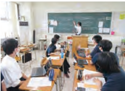
話し合い活動 (学校生活宣言の提案)