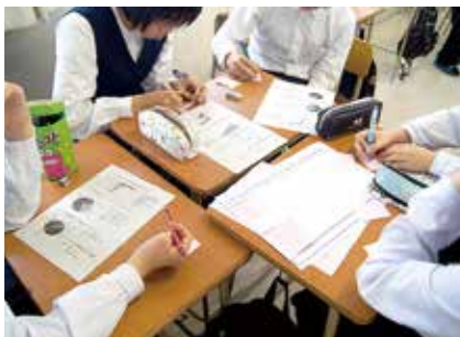
話し合い活動 (学校生活宣言の提案)