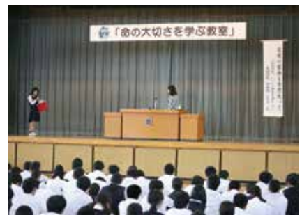
命の大切さを学ぶ教室