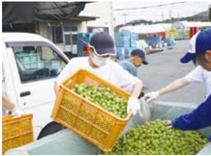
グリーンファーム体験