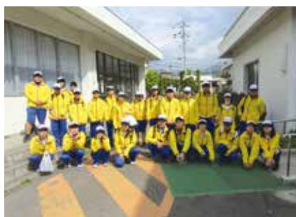
榛名ヒルクライム ボランティア参加