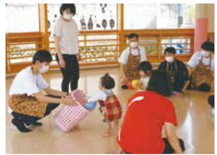
榛名児童館での保育補助 (スマイルクラブの活動)